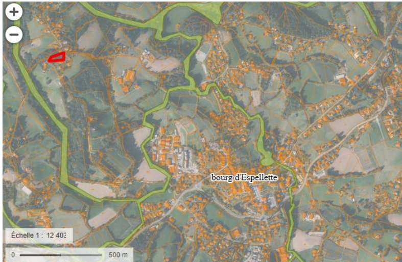
Vue générale de la situation de la parcelle A 935. En rouge, parcelle A 935. ZNIEFF de type 2, réseau hydrographique des Nives en vert

La parcelle s'inscrit dans un groupe d'habitations significatif. Elle n'est pas directement concernée par un zonage Natura 2000, ni par une ZNIEFF. Toutefois un ruisseau temporaire en contrebas, à moins de 150m est intégré à la ZNIEFF de type 2.