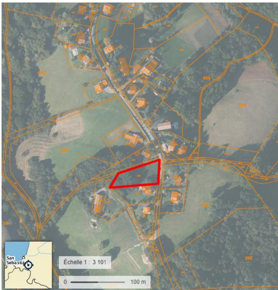
Vue zoomée de la parcelle dans son environnement

La parcelle s'inscrit dans un groupe d'habitations significatif. Elle n'est pas directement concernée par un zonage Natura 2000, ni par une ZNIEFF. Toutefois un ruisseau temporaire en contrebas, à moins de 150m est intégré à la ZNIEFF de type 2.