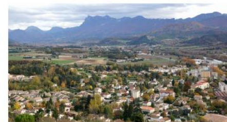
Le SCoT, schéma de cohésion territoriale qui réunit les deux communautés de communes du Crestois et du pays de Saillans, et du Val de Drôme en Biovallée, soit 44 communes et 46 305 habitants, a été présenté jeudi 29 novembre à Eurre.

Six ans de travail résumés en un peu plus de deux heures. C'était le challenge de la présentation du SCoT (schéma de cohésion territoriale) de la vallée de la Drôme qui a eu lieu jeudi 29 novembre à l'école de Eurre, devant près de 100 personnes.