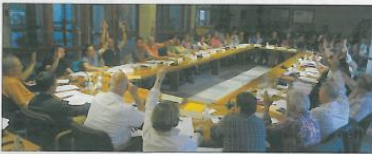
Avec 24 voix pour, déménagement et financement ont reçu un avis favorable

Conseil express pour les élus de la CCCPS en ce 19 mai. Il s'agissait, comme nous l'avons écrit la semaine passée, de voter le nouvel emplacement du centre aquatique et de valider le plan de financement. Et c'est avec 24 voix "pour" et 15 "contre" que tout ceci a été décidé, non sans que quelques élus ne donnent leur façon de voir les choses au président et aux vice-présidents.