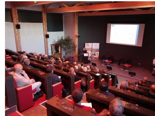
Réunion Plénière du 4 avril 2019

L'assemblée a aussi souligné la forte attractivité du territoire et le déficit d'emploi à combler afin d'offrir aux nouveaux arrivants un emploi (« déficit actuel de 6000 emplois sur le territoire »). La problématique des déplacements pour se rendre sur son lieu de travail est également évoquée ainsi que le lien entre la logistique et la mobilité.