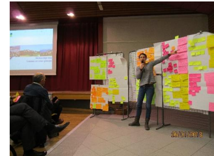
Echange en sous-groupes et restitution

Afin de pouvoir finaliser le diagnostic et les analyses thématiques, il est nécessaire de caractériser l'armature territoriale sur laquelle repose le fonctionnement et l'organisation du territoire aujourd'hui. Le souhait des élus du syndicat mixte du SCoT est que cette vision soit largement partagée par l'ensemble des élus du territoire du SCoT avant de poursuivre par les enjeux pour l'avenir.