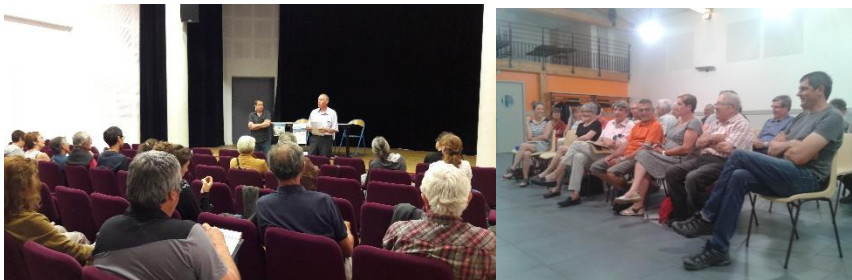
Réunion publique à Saillans et Beaufort-sur-Gervanne