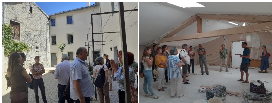
Visite du tiers lieu l'Avant-Poste et de la résidence Blagnac à Die