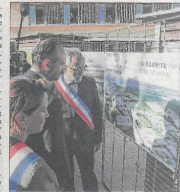
Édouard Philippe, premier ministre, était récemment au campus de la Biovallée à Eurre, où se déroulera la réunion publique du 2 octobre.

Le PADD est téléchargeable sur le site internet du Scot ( www.scot-valleedrome.fr ) dans la rubrique « Téléchargement » puis « PADD ».