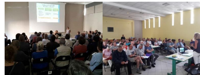
Plénière des élus du territoire – 8 juin 2018 -Salle AMAPE (Crest)

Cette réunion a suscité l'intérêt des 60 élus présents, les échanges et retours ont été riches.