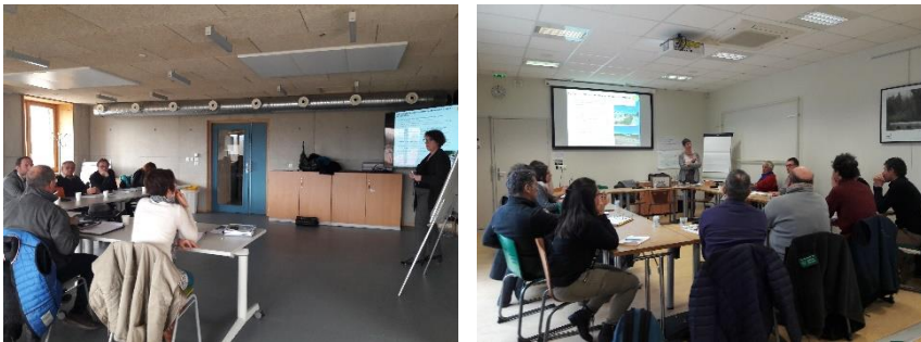
Atelier du territoire, travail en groupe et plénière du 7 février 2019

Ces ateliers ont réuni une trentaine de participants.