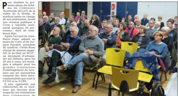
Un auditoire attentif à la présentation du diagnostic.