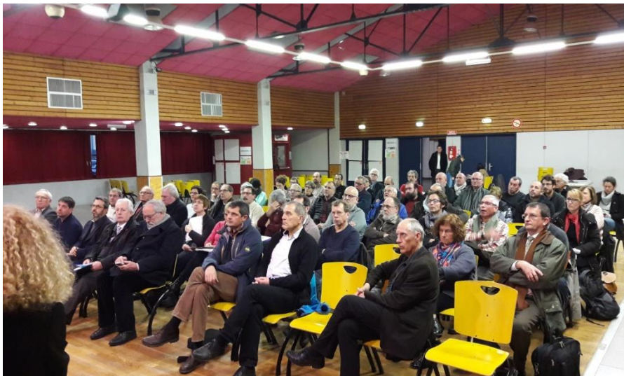
Réunion plénière – 24 janvier 2018 - Salle coloriage (Crest)