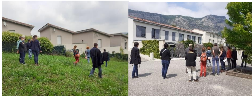
Sur le terrain à la découverte des logements de La Roche-sur-Grane et Saoû