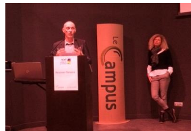
Discours du président Jacques Fayollet lors de la réunion plénière du 6 février 2020

Une troisième plénière a également été organisée pour présenter le projet SCoT et des principaux éléments du Document d'Orientations et d'Objectifs le 27 septembre 2023. Elle a réuni environ 40 personnes dans l'amphithéâtre.