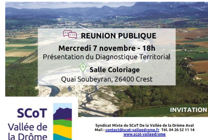
Affiche de la réunion publique du 7 novembre 2018

La phase de diagnostic s'est clôturée par une restitution lors d'une réunion publique à la Salle Coloriage de Crest le 7 novembre 2018 qui a réuni environ 70 personnes.