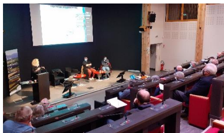
Réunion Plénière – 1 décembre 2021

À cause des conditions sanitaires en vigueur, nous avons été contraints de limiter le nombre de présents et avons organisé une visioconférence en parallèle. Environ 40 personnes ont participé en présentiel à cette réunion.