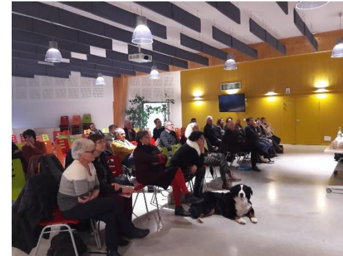
Commission thématique – 7 février 2019 – Biovallée le Campus (Eure)

La phase de PADD débute début 2019. Une commission thématique est organisée le 7 février 2019 à destination de l'ensemble des élus du territoire.