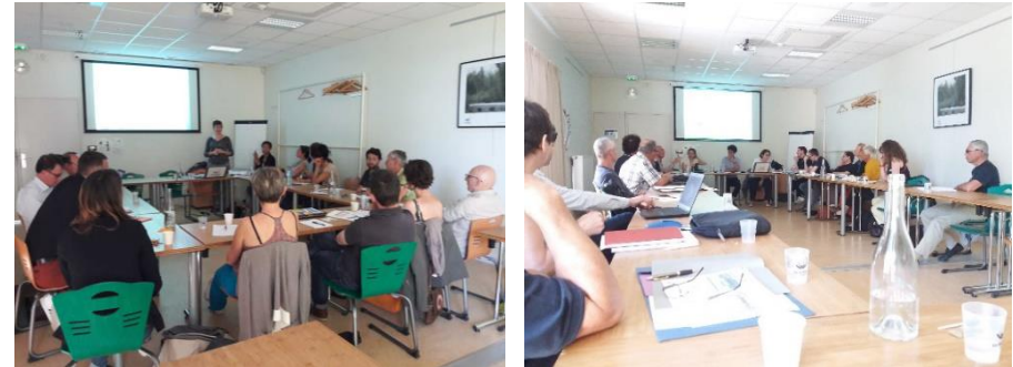
Atelier « Environnement » et « Economie » - 23 et 24 avril 2018 – Biovallée le Campus

En totalité, 43 acteurs du territoire ont participé à ces ateliers.