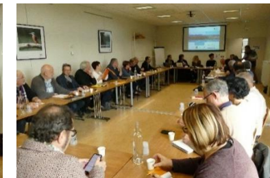
Commissions thématiques - salle trois becs (Campus Biovallée)