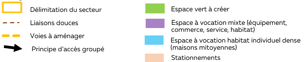
Schéma des orientations d'aménagement du secteur n°239-2