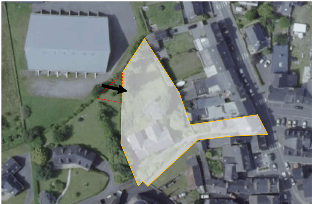
Schéma des orientations d'aménagement du secteur n°143-9

Emplacement réservé pour prévoir l'accès via la parcelle Ue au nord-ouest