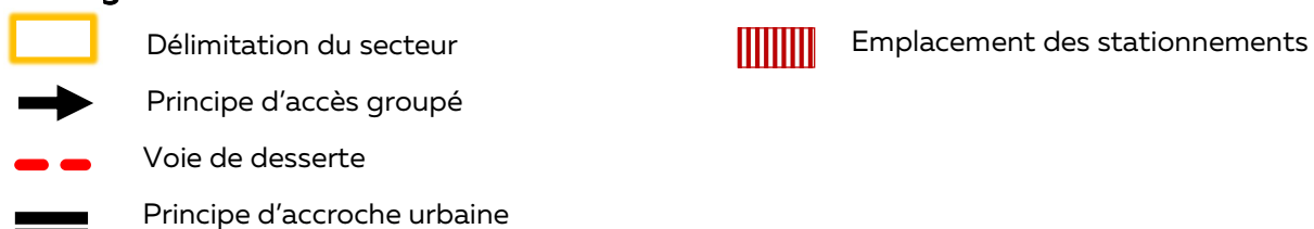
Schéma des orientations d'aménagement du secteur n°143-2