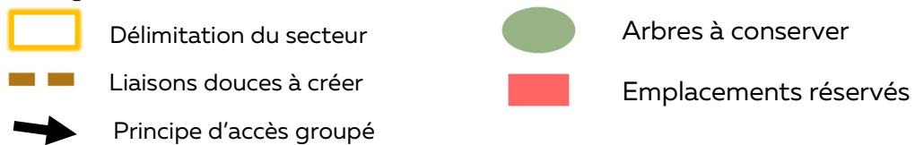
Schéma des orientations d'aménagement du secteur n°049-9