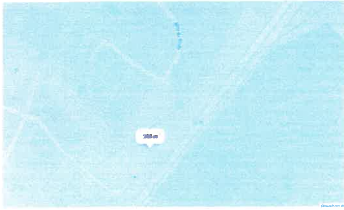
Parcelle AH 198